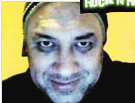
INSISTIR Y A VECES FRACASAR CON ROTUNDO ÉXITO.